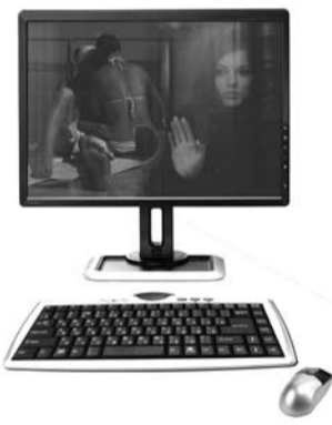
Скоро детей в интернете делать будем... 1 место

20 февраля в СамГТУ на базе информационного центра факультета гуманитарного образования прошел областной тур Вторых Малых Дельфийских игр в номинации «Социальная реклама».